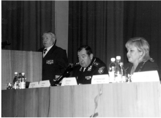
Вступление на конференции