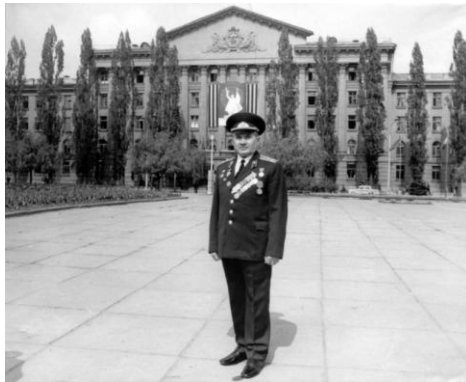
Возле главного корпуса Киевской высшей школы МВД СССР