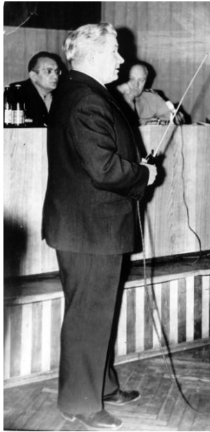
Лекция проф. М.В. Салтевского