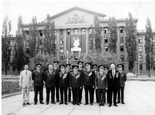
Коллектив кафедры криминалистики Киевской высшей школы МВД