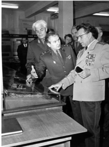
Посещение кафедры криминалистики Киевской высшей школы МВД СССР министром МВД СССР Н.А. Щелоковым