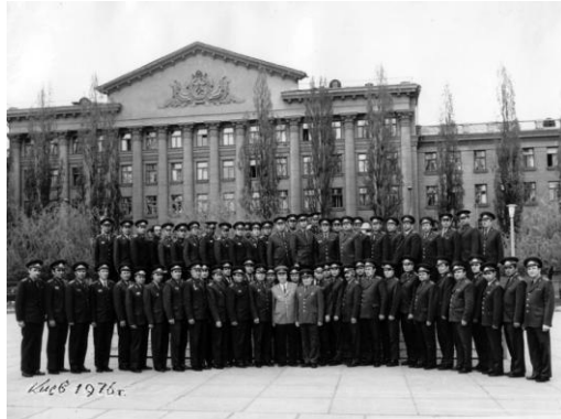
Возле главного корпуса Киевской высшей школы МВД после парада, посвященного празднованию Великой Октябрьской революции (1976 г.)