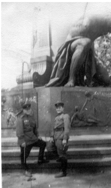
В Берлине после Победы - 1945 г.