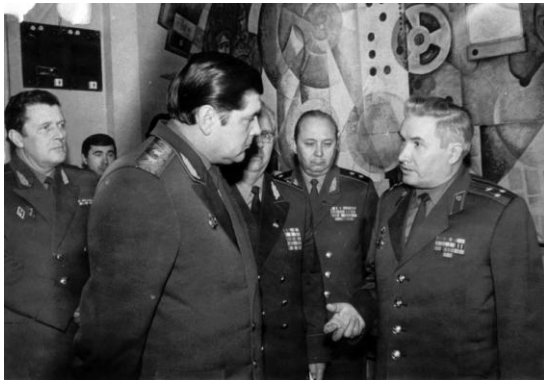
Посещение кабинета кафедры криминалистики Киевской высшей школы МВД первым заместителем Министра МВД СССР генерал-полковником Ю. М. Чурбановым (в центре)