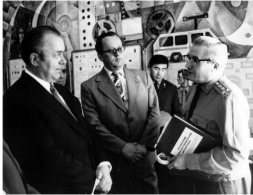
Представители Чехословацкой Социалистической Республики в кабинете кафедры криминалистики Киевской высшей школы МВД СССР