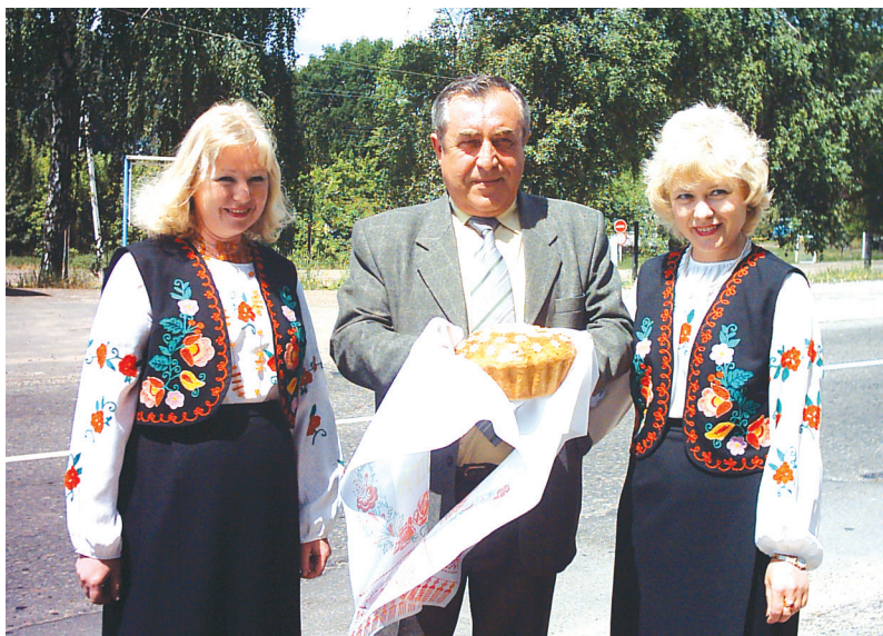
На рідній Сумщині