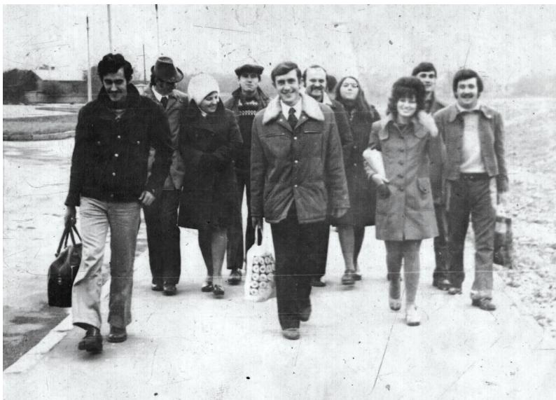
З однокурсниками під час навчання у Харківському юридичному інституті ім. Ф.Е. Держинського