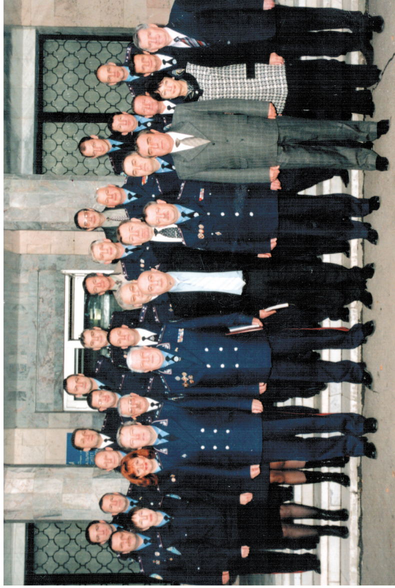
Учасники конференції «Організація виховної роботи у вищих навчальних закладах МВС України» (м. Харків, 2002 р.)