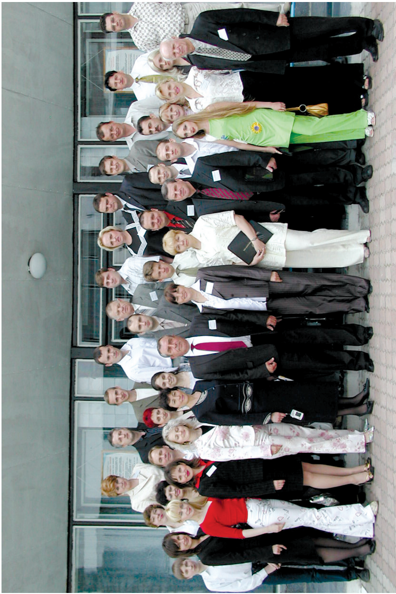
З колегами, членами Української асоціації фахівців трудового права (2005 р.)