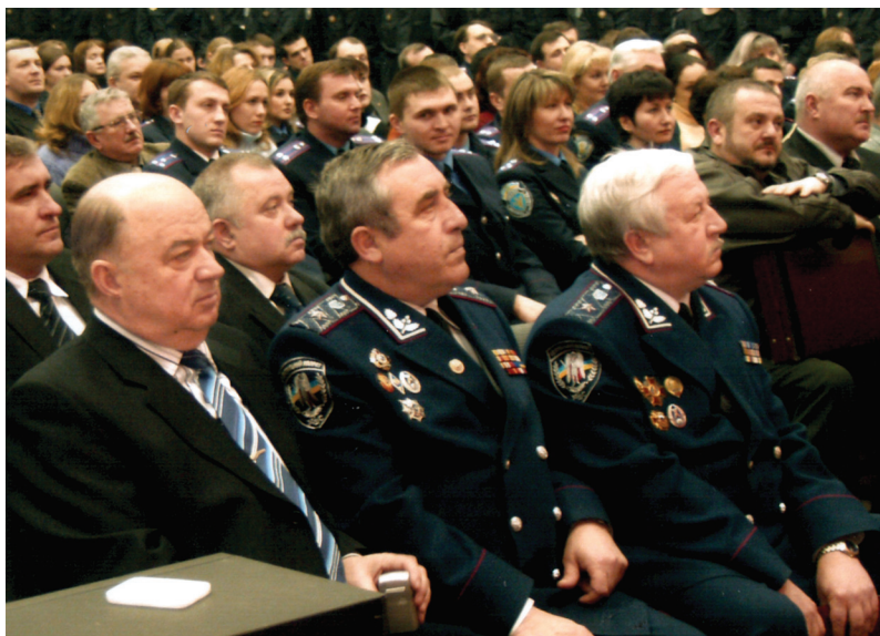
На нараді у Національному університеті внутрішніх справ (в центрі - В.С. Венедіктов, ліворуч - В.Я. Тацій, ректор Національної юридичної академії ім. Я. Мудрого, праворуч - генерал-майор міліції О.Н. Ярмиш)