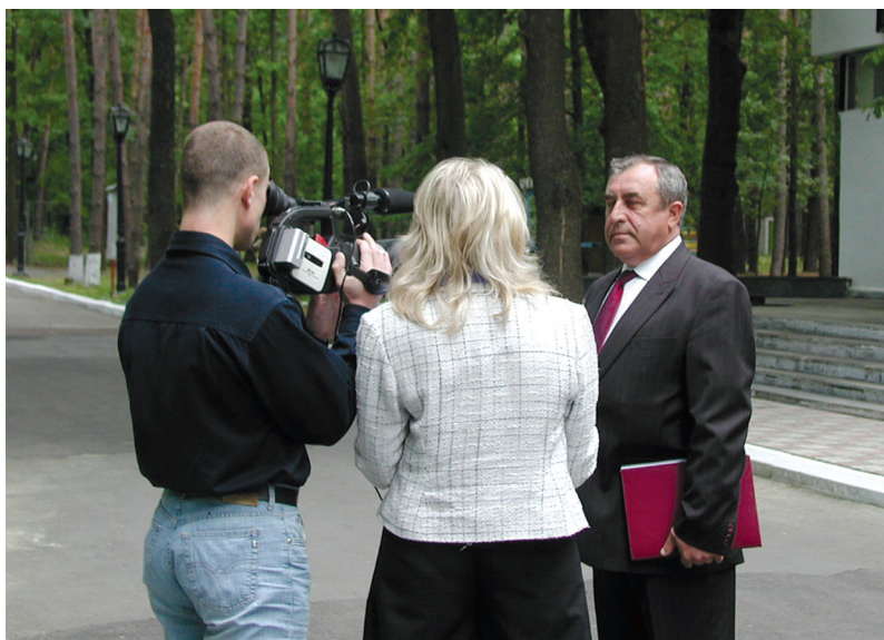
Під час інтерв'ю з Президентом Української асоціації фахівців трудового права