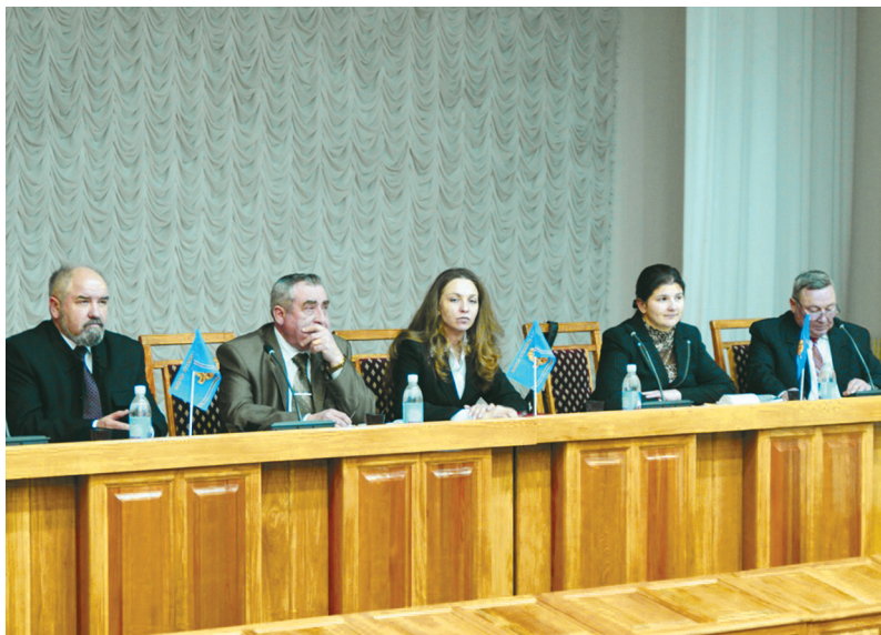
Під час конференції з питань адвокатської діяльності у Харківському економіко-правовому університеті (2010 р.)