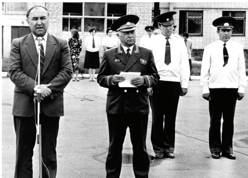
Під час привітання першокурсників Університету внутрішніх справ (у центрі - ректор О.М. Бандурка, праворуч - проректори П.І. Орлов та В.С. Венедіктов)