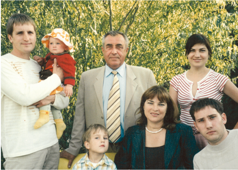
У колі дружньої родини