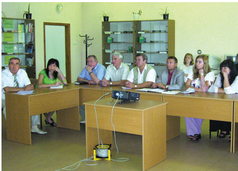
Засідання вченої ради Харківського економіко-правового університету (2011 р.)