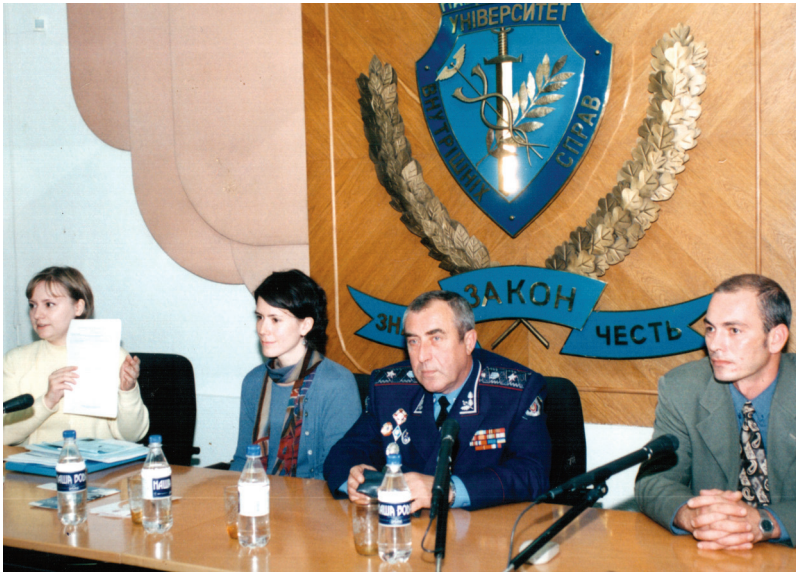
На конференції «Актуальні проблеми управління персоналом органів внутрішніх справ України» (м. Харків, 2002 р.)