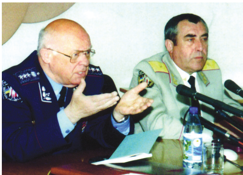
На нараді з ректором Національного університету внутрішніх справ О.М. Бандуркою