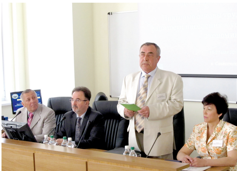
На конференції «Правові засади працевлаштування та зайнятості населення в умовах ринкової економіки» (м. Севастополь, 2011 р.)