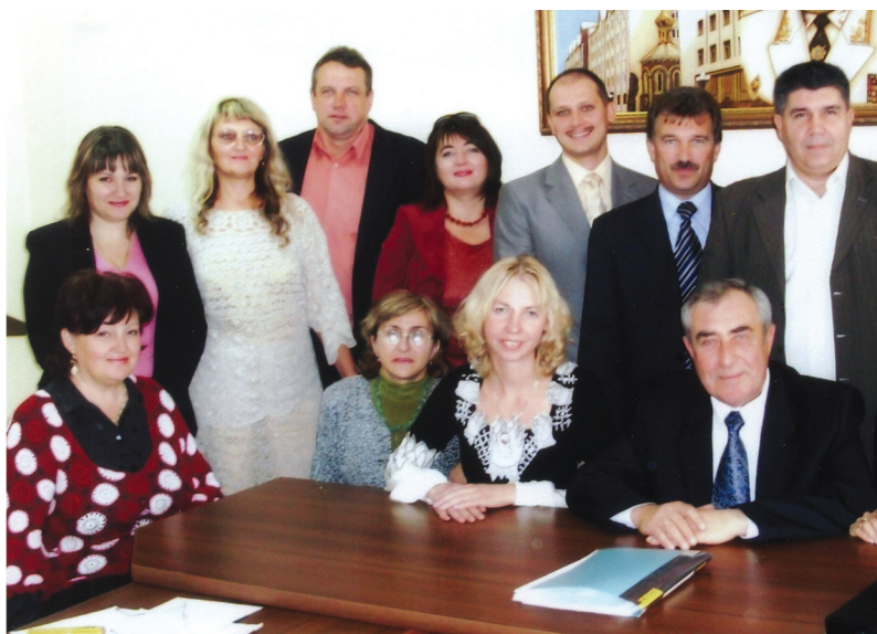
Під час круглого столу з питань трудового права у Луганському державному університеті внутрішніх справ ім. Е.О. Дідоренка (2009 р.)