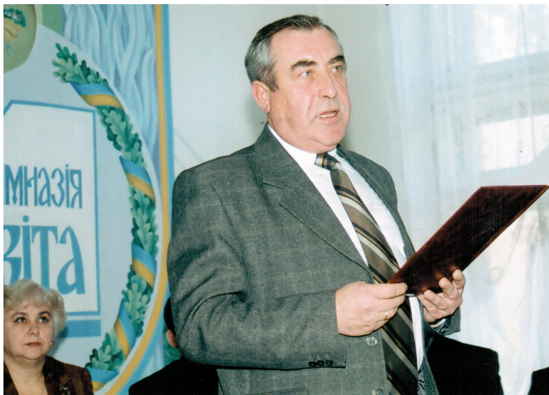
На конференції «Розвиток освіти в ліцеях і гімназіях в умовах шкільної реформи» (м. Харків, 2003 р.)