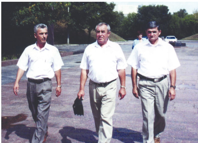
З колегами у м. Кіровограді