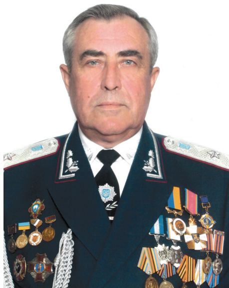
Після присвоєння спеціального звання генерал-майор міліції (2000 р.)