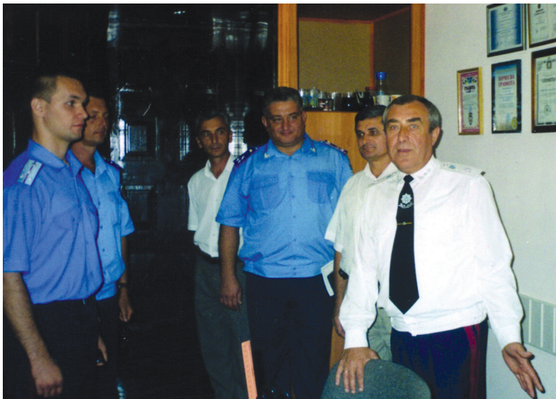
На факультеті Національного університету внутрішніх справ у м. Кіровограді (2003 р.)