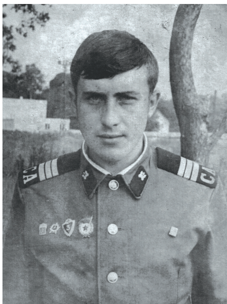
Служба у лавах Радянської армії