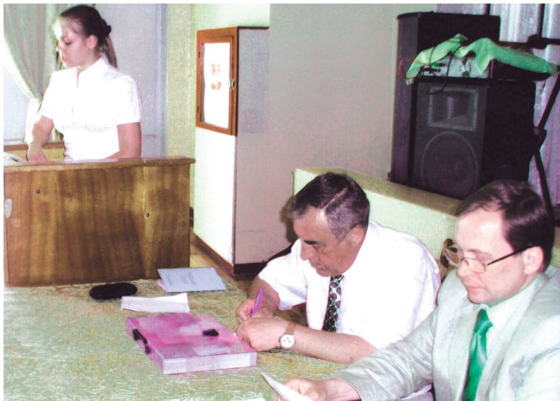
Під час доповідей молодих науковців на конференції «Трудове право України в контексті європейської інтеграції» (м. Чернігів, 2006 р.)