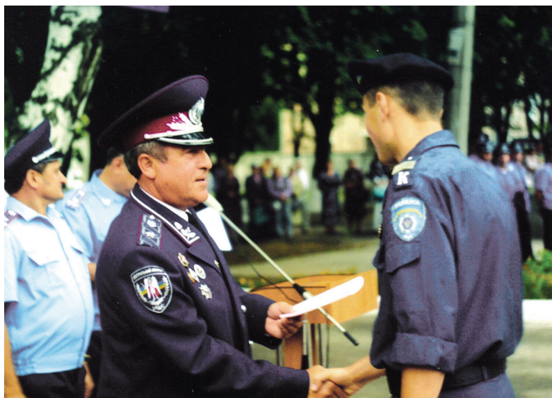
Під час урочистого вручення дипломів випускникам Національного університету внутрішніх справ